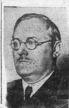
Прокурор СССР А. Я. Вышинский