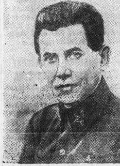
Народный Комиссар внутренних дел Н. И. Ешов