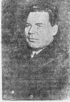
Народный Комиссар военно-морского флота П. А. Смирнов