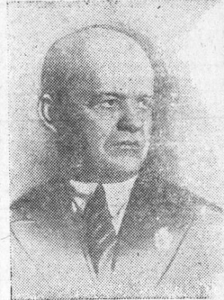
Заместитель Председателя Совета Народных Комиссаров СССР и Председатель Комиссии Советского Контроля С. В. Косиор