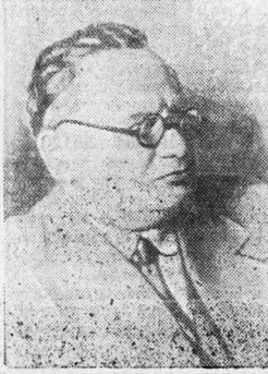
Народный Комиссар иностранных дел М. М. Литвинов