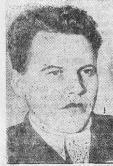
Председатель Госплана СССР Н. В. Вознесенский

Выступавшие товарищи заявляли, что трудящиеся будут большевистски выполнять решения Сессии, будут еще сильнее крепить мощь нашей великой родины.