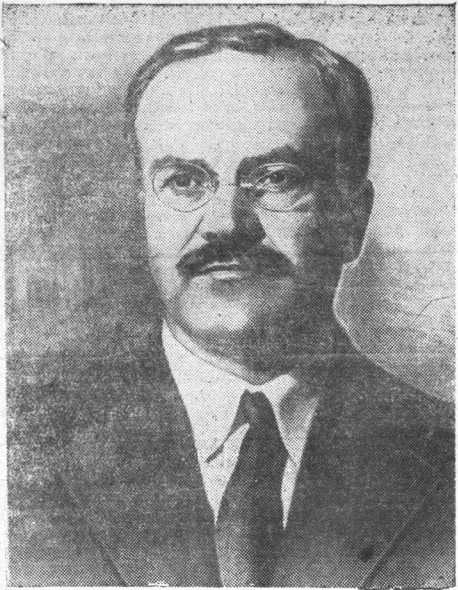
Председатель Совета Народных Комиссаров СССР В. М. Молотов