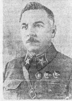
Народный Комиссар обороны К. Е. Ворошилов