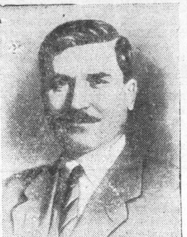
Заместитель Председателя Совета Народных Комиссаров СССР В. П. Чубарь