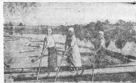
Слав по р. Колье (Бабаевский район). Сортировка древесины.