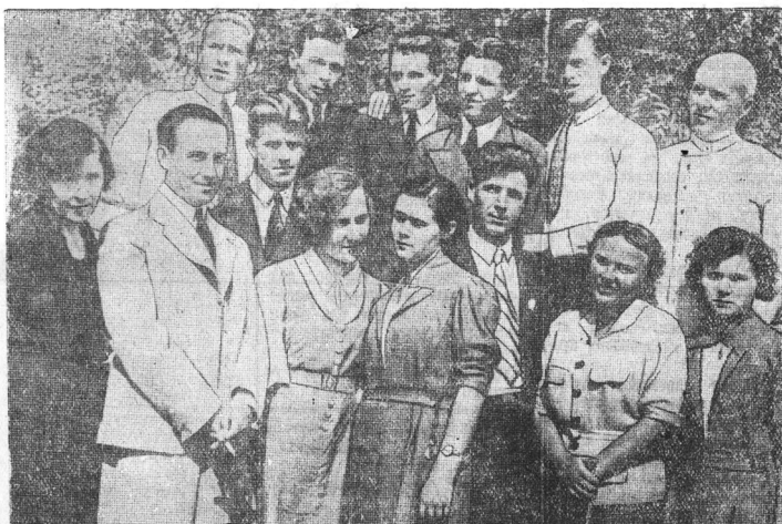
Коллектив артистов Устюженского государственного колхозно-совхозного драматического театра.