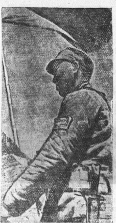
На снимке: замесивший китайской национально-революционной армии.

МАДРИДА, 15 июля. Вчера состоялось заседание постоянной комиссии испанского парламента (кортесов). Делегация пролила на нее свое военное положение. Убер-Валенсию отстал распоряжение мобилизации для фортификационных работ всех граждан, имеющих призыв на военную службу в 1922, 1923 и 1924 гг.