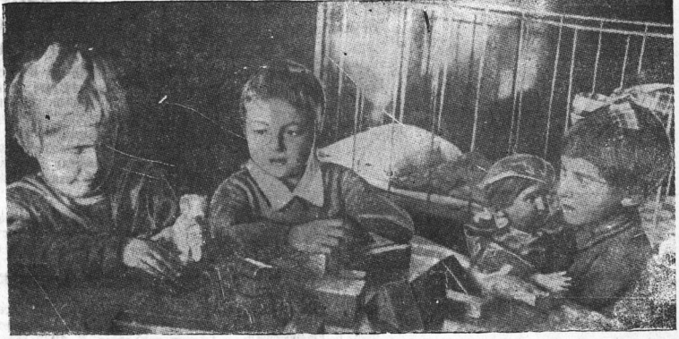
В детском саду № 17 (Вологда). Дети за игрой.