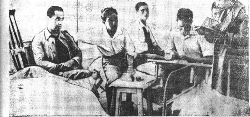
В республиканской Испании. На снимке: в одном из военных госпиталей, учительница читает вслух выздоравливающим бойцам.