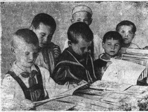
На книжной базе в саду ВЛВРЗ.