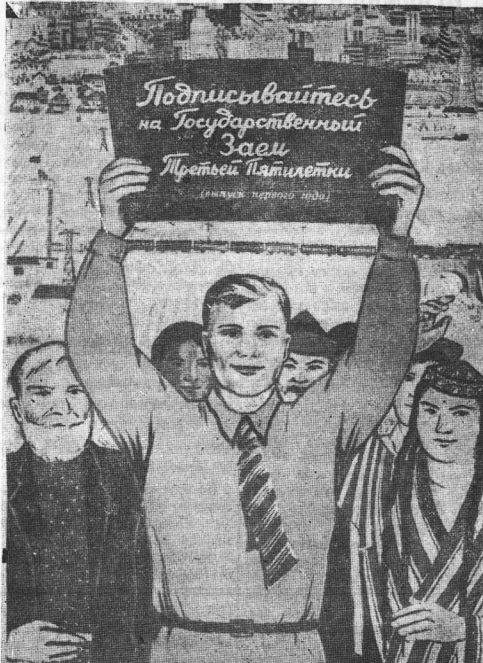
УСПЕШНЫМ РАЗМЕЩЕНИЕМ ЗАЙМА ЕЩЕ БОЛЬШЕ УКРЕПИМ НАШУ ЦВЕТУЩУЮ СОЦИАЛИСТИЧЕСКУЮ РОДИНУ

Исключительно жаркая погода в апреле и мае вызвала в Средней Азии энергичный рост хлопчатника. В Туркмении, например, хлопок, посеянный 9 апреля, зацвел 11 июня. А в прошлом году хлопок, посеянный в то же время, зацвел лишь 22 июня. В ряде районов развитие хлопчатника превышает на 13—15 дней раньше прошлого года. Таким образом, можно ожидать, что и уборка начнется в более ранние сроки. В южных районах Средне-Азиатских республик хлопок всюду цветет. Растения развиваются отлично.