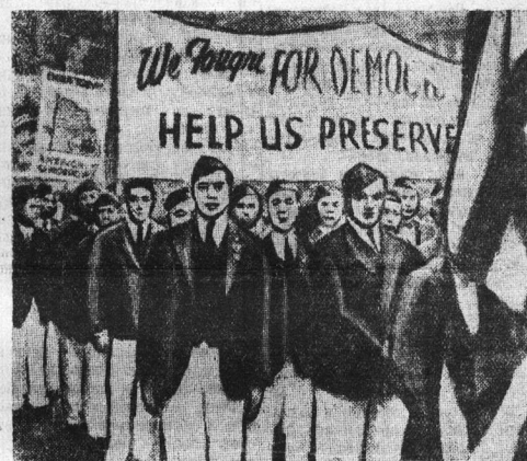
В Нью-Йорке состоялась демонстрация китайцев-ветеранов войны, призывающая к защите населения Китая от японских интервентов.

ЛОНДОН, 14 июля. Кантонский корреспондент агентства Рейтер сообщает, что ветеран 13 японских самолетов снова совершил налет на Кантон. Около 30 бомб было сброшено в районе электрической станции.