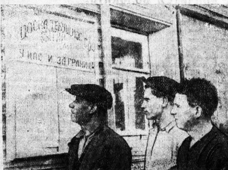
Колхоз им. XVII парт езда, Вологодского района.