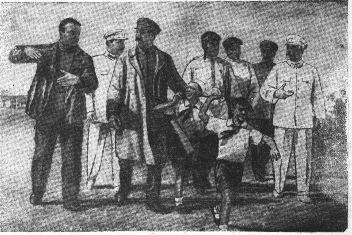
«Встреча героического экипажа» — картина художника П. Т. Мальцева. (Выставка «XX лет РККА и Военно-Морского Флота»). Репродукция Союзфото.

Новые советские школы должны быть построены крепко, красиво и точно в срок — к началу учебного года. Этого требуют партия и правительство, такое же требование к строителям предъявляют наши советские дети и учителя.