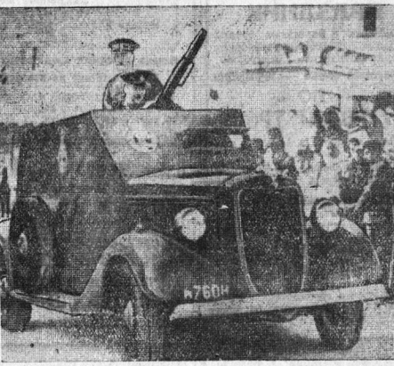
К событиям в Палестине. На снимке: бронированный автомобиль английского правительства на одной из улиц города Хайфы.

ПАРИЖ. 4 августа. По сообщению агентства Гасас, наступление республиканских войск, начатое 1 августа в горах Альбаррасин (в 50 километрах к западу от Теруэля), продолжается с успехом. Республиканцы заняли вершины горного района Альбаррасин, которые в течение долгих месяцев находились в руках мятежников и были ими сильно укреплены. Республиканцы взяли эти позиции искусно проведенным маневром и противник с минимальными потерями на восток к горам Универсалес. Республиканцы закреплены на высотах, откуда берут свое начало реки Тахо и Гвадалавар, и ведут дальнейшее наступление.