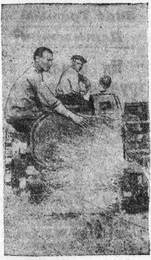
Уборка льна льнотеребилькой ВНИИ-5 в колхозах, обслуживаемых Перской МТС, Устюженского района.