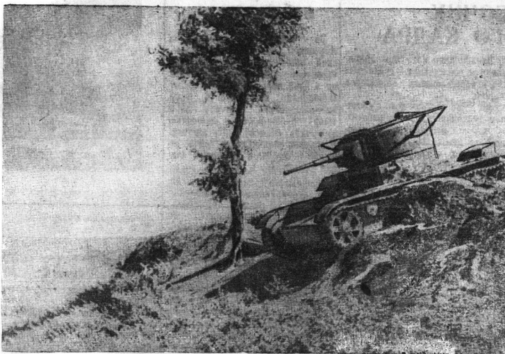
На тактических учениях Н-ской части Киевского военного округа. На снимке: танк на учениях.

«Мы, рабочие завода «Северный коммунар», — говорится в конце резолюции, — еще теснее сплотим свои ряды вокруг Центрального Комитета нашей партии, вокруг любимого вождя и учителя великого Сталина».