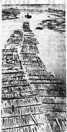
Лес идет. Отозвон Д. Ленсона.

Творчество выдающегося русского художника О. А. Кипренского ярко знакомит посетителя выставки с эпохой и людьми первой половины XIX века.