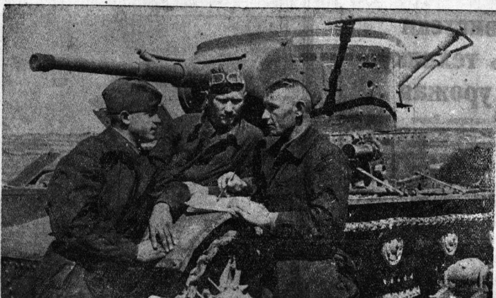
Комсомольский экипаж танка Н-ской части Киевского военного округа включился в соревнование младших командиров к XX-летию Комсомола и взяла на себя обязательство отлично провести все виды боевой и политической подготовки к осенним тактическим учениям.

«Зимовщики полярной станции острова Диксон, экипажи ледовых разведчиков самолетов «СССР Н-243» и «СССР Н-233» приветствуют твердую политику нашего правительства в международных вопросах. Мы шлем пламенный привет нашим славным пограничникам, бойцам, командирам и политработникам Дальневосточного краснознаменного фронта, стойко выполняющим свой долг перед родиной, умело отражающим наглые вторжения японских захватчиков».