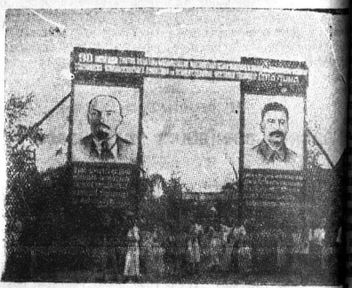
Празднование Всесоюзного дня железнодорожника в Вологде. На снимках: 1. Железнодорожники получают книги для чтения в библиотеке сквера гортеатра. 2. Момент эстафеты на стадионе «Динамо» в честь Дня железнодорожника. 3. Вход на Октябрьский бульвар.