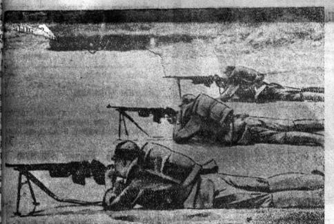
На снимке: бойцы китайской армии в засаде.

ходило по главе колонны и которое, по мнению было крейсера «Альмиранте Сервера». Второе судно — типа крейсер «Канариас», два остальных — миноносцы. Летчики заметили, что три бомбы разорвались на корме головного судна мятежников, одна бомба разорвалась на носу того же судна. Спрогнозирование корабль мятежников трехмоторные самолеты обратились в бегство.