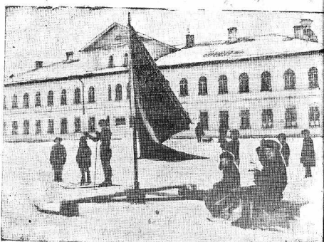
Пионеры зимнего лагеря (Завокинского) готовят лыжи к началу бега.

На литографиях редакции, допустившей эту ошибку, наложено выписание.