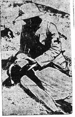
На снимке: абиссинский санитар идет раненому абиссинскому солдату (Лайон Аббе)

АФИНЫ, 5. Греческая печать публикует обращение французского интеллигентца за 80 тысячам подписей, адресованное греческому королю и требующее всеобщей амнистии политическим заключенным в Греции. В числе подписавших это требование Роман Роллан, Ланжевен, Черри, Вязгор Маргеритт, Жан