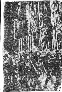
7 марта Германия расторгла Локарнский договор и объявила о демилитаризации Рейнской зоны. В тот же день началось выступление германских войск в Рейнскую демилитаризованную зону.

ЛОНДОН, 14. Сегодня в Сенском дворце открылась чрезвычайная сессия Совета Лиги наций. Открыл сессию Брос (Австралийский) указав, что в повестке дня лишь один вопрос — о Локарнском договоре. Затем Брос за телеграммы правительства в Берлине и Бельгии, которыми этот договор был расторгнут. Бельгийский министр иностранных дел Иден, заявил: «По инициативе британского правительства, на несомненное нарушение Локарнского договора, касаясь демилитаризованной зоны, а также нарушение Локарнского договора. Если Совет Лиги наций согласен с этим выводом, то он должен выработать решение заочным путем, перед которыми мы государства, подписавшие Локарнский договор вместе с нами, и коллеги по Совету Лиги наций должны рассчитывать на полное сотрудничество английских государств во всех попытках вернуть мир и взаимопонимание народам Европы на твердой прочной основе». Иден подчеркнул, что Франция имеет право принять срочные меры в ответ на действия Германии, но предпочла апеллировать к Лиге наций. Фландцы указали на франко-советский договор для Германии лишь предельно давно подготовленного. Речь не идет лишь о правах Лиги или об обязанностях государств, сказал Фландец, а о всеобщем и осуществлении самой Лиги. Необходимо знать, каковы договоры рассматриваются,