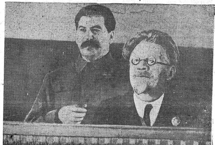
Совещание передовиков животноводства с руководителями партии и правительства. На первом: ст. И. В. Сталин и М. И. Калинин на совещании.

В займовой работе, как и в любом участке социалистического строительства, победу решают люди. Делается отличница, поэтому, должны не только ликвидировать оставшиеся червяки по займу, но и выдать новые десятки и сотни своих отличников финансового дела. Иногда такие карты, мы будем выполнять финансовые обязательства на месяцы в месяц, не допуская ни малейших прорывов.