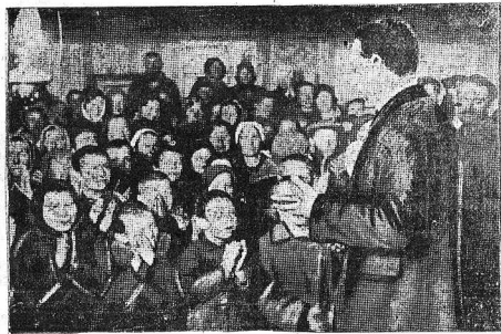
Артисты Вологодского государственного театра юного зрителя в отрывке постановление крайкома партии о культурно-просветительной работе в деревне в пьесе И. Фельера «Серий и молот».

В перенесенной колхозной постановке собраны колхозники и колхозницы в летний ТЮЗ почвады чести с небольшими песнями: «Дети-иница парочка», «Одна комната», «Хороший концерт и Юбилей». Артисты выступили также с рассказами и декламацией. Колхозники благодарны ТЮЗ за посещение.