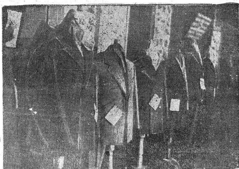
Таков общий вид магазина-базара Волторга на базарной площади. В продуктовой отделе работает лишь один человек, а образуются очереди, за хлебом люди ждут. Магазины завалены всяким хламом. На полу—грязь, сломанная бумага и трава. В магазинах часто нависают сосиски.