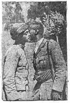
На снимке: абessinский солдат, отправляясь на фронт, прощается с сыном.

Сахарная промышленность Союза выпустила в 10 февраля 139,4 миллиона пудов сахара. С 10 февраля на всех действующих сахарных заводах начался стахановская декада. Успешнее всего ее проводят заводы Воронежской области. Все они перевыполнили свои суточные планы, снизив по сравнению с январем потери и увеличив выход сахара из свеклы.