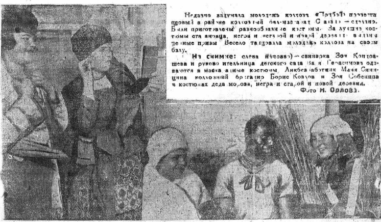
Старшем на постановке спектакля ВКП(б)

Для налаживания работы самостоятельных кружков, комплектуется 350 организаторов музыкальных, хороших, драматических, изобразительных и физкультурных кружков. В Воляжском районе намечено построить в этом году пять бани. Крайком партии постановила, в марте 1936 года созвать краевое совещание по вопросам культурно-просветительной работы в деревне.