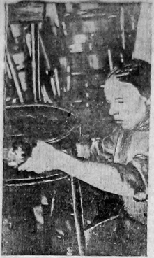
Подготовка стульев в артели «Венгуст»

● В Вологде созываются межрайонные курсы заведующих базами. Курсы продлятся один месяц. Окончившие курсы будут направлены в районы заведывать нефтебазами.