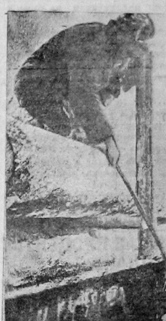
Погрузка на платформу лесоматериала, отправляемого со станции Леса в Москву

Неорганизанность работников Севлессбыта, плохая организация труда на погрузке лишила район возможности вы-