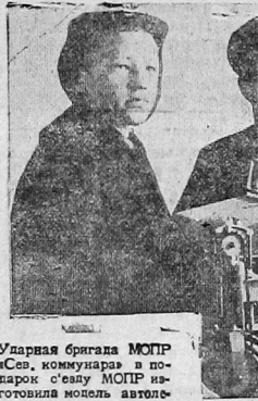
Ударная бригада МОПР «Сев. коммунара» в подготовке к севу МОПР изготовила модель автомобиля

Надо усилить классовую работу в СССР в 1933 году в рядах мопровских организаций. Все это даст возможность добиться новых побед в нашей работе.