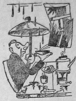
Таковы квартиры жалки № 11

Первая наша задача сделать жилища чистыми, теплыми и светлыми и за нее нужно драться со всей силой, со всей напористостью.