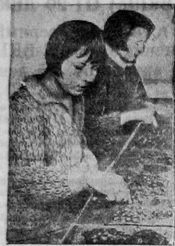
Сортировка пугович в пуговичной артели