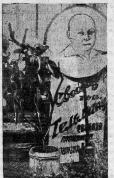
В токарном цехе ВПРЗ идет борьба за чистое и культурное рабочее место. Около станков вешают красивые цветы.

Работает фото-кружок. На днях организуются струнный оркестр. Свободный час проходит интересно и весело.