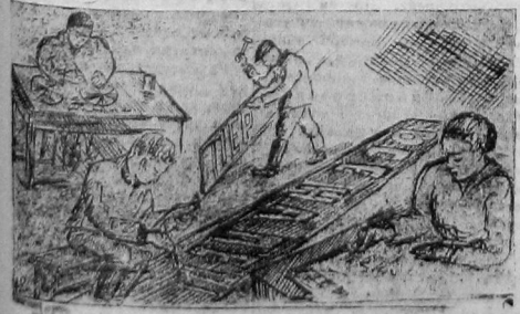
Подготовка и демонстрация на швейной фабрике.