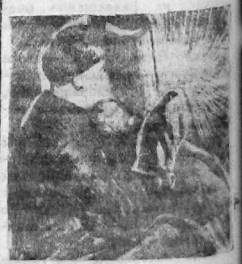
Электрогенераторы Монаков за сваркой фермы грузовика «Викинг» автозавода.

На заводе «Северный коммунар» не торопятся с оборудованием вновь выстроенного токарного цеха. Похолодание предвещает снег, а в цехе нет еще ни одной рамы. Крыша хотя есть, но верхнее окно в крыше не застеклено. Работы по оборудованию цеха идут очень медленно. Хозяйственная часть завода обязана усилить работы по установке рам и застеклению. ПЕТРОВ.