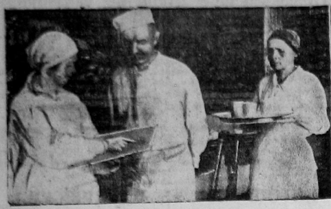
На ПРЗ открыта девятисемя столовая для рабочих. На фото—дежурный врач знакомится с меню обеда