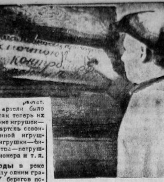
Письмоиздателя Гавриладского сельсовета рассказали на бабах колхозников пакеты о времени прихода почты

Когда же Совхозно перестроит свою работу по обслуживанию колхозов хорошими картинами?