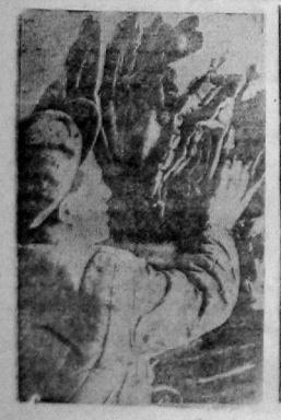
900 комплектов телогреек и шарфов вывела швейная фабрика для леспорбаз. На снимке — авт. слайдом в. Боль ерт собирает продукцию.

Шитова и другие еще не получили тех выгод, какие дают трудящимся коллективное страхование. Активистка борется за мобилизацию средств в пользу коллективного страхования. Шитова обязалась провести новыми членами артели активную работу с таким расчетом, чтобы к годовщине Октября все они были охвачены коллективным страхованием. Петров.