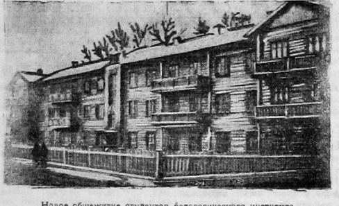
Новое общежитие студентов биологического института