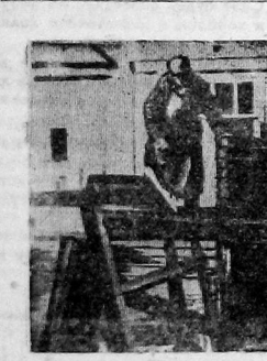
На территории паровозо-вагоноремонтных заводов к Октябрьскому празднику будет сооружен памятник В. И. Ленину. На фото — укладка фундамента под памятник.

Расширилась и крепко организованная сеть партпрофсоюзных (работает начальная школа, а также техникума на хорошо, передает свой опыт молодым товарищам. Перевоплощая производственные показатели, удаляя не мало времени на общестроительную работу, не уступают ему боду Лебедева и обвальщик колхозного цеха Кожеркина, которых коллектив передает в ряды Красной армии. При общем росте есть и недостатки. Гересвету раскраса депутатскую группу, на мясокомбинате нет ни одного скандинава. Струнный оркестр и драматический кружок организовала молодежь совхоза «Южок». Обустраивается годовщине Октября красной уголок.