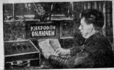
Вологодский родно-узел организовал целины цеха передовых работников отечественной промышленности. «Работы ударников» из микрорайона культурмейстеры, сескаторы и др. На фото — руководитель радиодетали тов. В. Эсский передает преддиректору трюнику

2 ноября новый экранизм художественный фильм ГОРОД В СТЕПИ драма в 7 частях по роману А. Серафимовича 26 КОМИССАРОВ