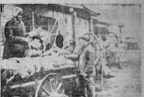
НА СНИМКЕ: колхозники колхоза «Известия ВЦИК», Топишевского сельсовета, участники общерайонного красного обзода, сдают лен.