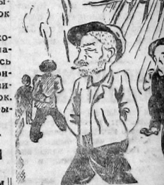
Так организована работа и часто неясно рабочий день на производственном заводе