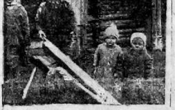
На снимке — первичная обработка льна ручной трепалой в колхозе «Строитель»