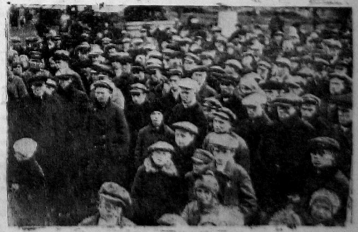
Митинг на территории совхоза.