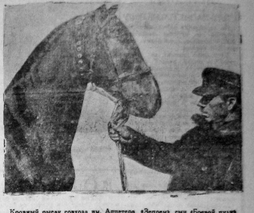
Кровный рысак сохозяи м. Аптепера «Энпрем» сви «Боевой пуги» и «Энпрем» внука рекордсмена «Крепшана» с лавандиком т. Мельничковим.