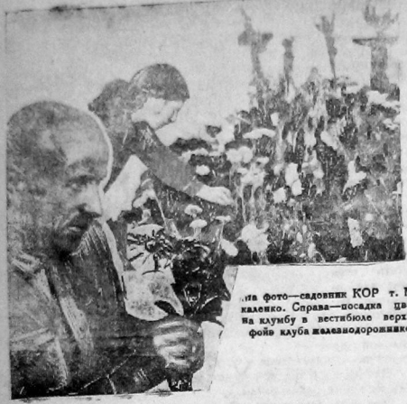
На фото—садовник КОР т. Москалево. Слева—посадки цветов на клубу в вестибюле верхнего фойе клуба железнодорожников