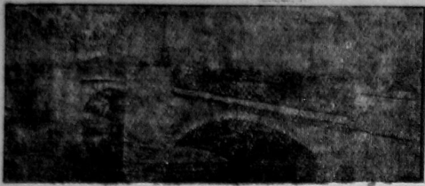
Октябрьский мост. До сих пор образований мост не имеет хороших подставок. Герметиком из смеси деревянного настила каменной мостовой. Далеко мостик, прелегающий к мосту, не ограничивается