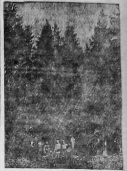
Экскурсия краеведов в заповедник государственного музея «Вологодскую Швейцарию»

После реорганизации работы краеведов и создания отделения общества изучения Северного края надо надеяться, активные краеведы будут у нас исчисляться не единицами, но многими десятками. Надо полагать, что, наконец краеведы будут работать в полном контакте с городскими хозяйственными