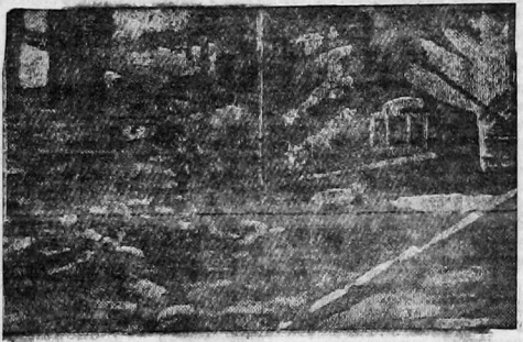
Одна из улиц в Омске, разрушенная тайфуном