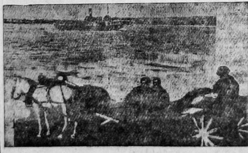
Экспедиция вологодских краеведов на реке Онеге.