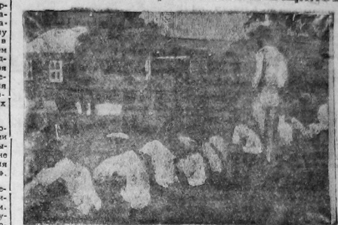
Цель солдат охраняет фабрику в г. Сенка (штат Южная Каролина), на которой работают швейцарцы. На переднем плане — группа бастующих

МЬЮ ИОРН. Тысячи текстильщики продолжают бастовать, вопреки решению профборкратов и производят беглые пикетирования. Предательство со стороны профборкратов вызвало сильнейшее негодование масс.