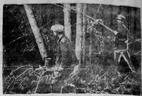
Валка леса на Лейском лесопункте