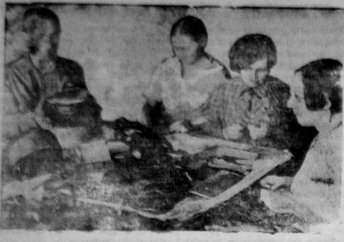
Бригада по пошивке детских шапок за работой в артели «Швейники»