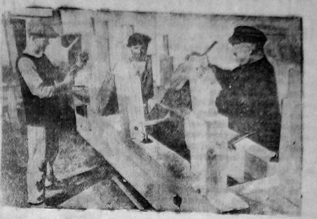
Завод «Северный коммунар» осваивает новый тип пресс-станков по чертежам «Станкопроект» для прессы тружков. В этом году завод должен выпустить десять станков. На снимке: Бригада столяров за сборкой первого станка.