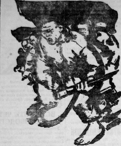
Рис. худ. Ф. ЭЛИССА

БЕИПИН. Японо-манчжурская печать сообщает об усилении партизанского движения в Манчжурии, а именно в районе японских правительственных железных дорог. По сообщению агента «Юнчунь», на отправленный полицейским управлением уезда Тунхуа на станцию Шаньчэньцзи для приема gasoline обоз в 15 грузовиков напала в селении Синцинь «шайка бандитов». Произоехл трехчасовой бой. По сообщению японского агента, в стачке убито девять человек из охраны и пять пассажиров, ранено 15 человек из охраны и 15 пассажиров.