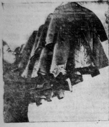
Заведующий производством артели «Швейник». Картины сортирует готовые детские пальто перед отправкой на базар

Артельсоюз не удосужился вчера провести итоги первого дня детского базара. Производство детских шапок готового платья налицо а ет с я еще слабо. К сегодняшнему дню, как сообщает заместитель председателя Артельсоюза т. Ново-