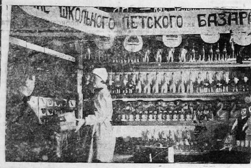
Подборк товаров в отделении детского базара универмага «Артельсоюз»

Варосые ведут себя значительно хуже. Здоровенные «дялеськи» и «тетьки» грубо ломаются в универмагах, нарушая очередь, вступая в пререкания с работниками прилавка Л-в.