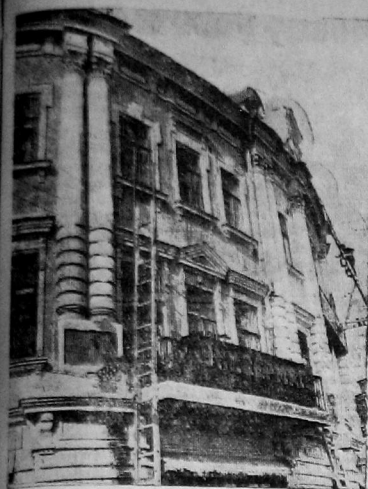
Ремонтируется здание горсовета