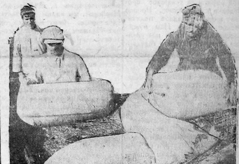
Передовые колхозы района организовали красные обомы с хлебом и мешками. Колхозники разгружали вагоны хлеба привезенного красным обомом на сепный пункт.

Центросоюзом отгружаются в районы закупки значительные партии товаров в лучшем ассортименте, имеющем спрос со стороны колхозов и колхозников. В числе отгружаемых товаров имеются: сельскохозяйственные машины, автомашины, гвозди, железо, оконное стекло, патефоны, мануфактура, рыба, сахар, селди и другие товары.