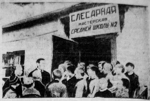
Новая слесарная мастерская средней школы № 2, оборудованная в помещении бывшей пивной