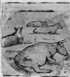
На снимке: стадо коров колхоза «Сдвиг» на пастбище