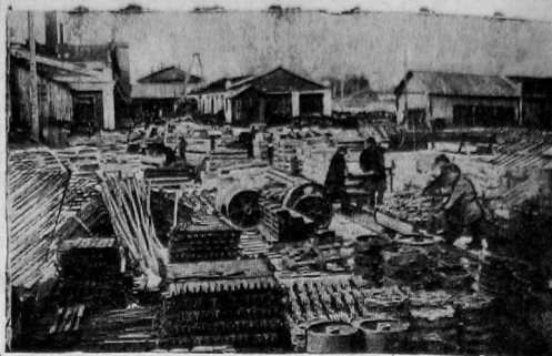
Упаковка частей машины на заводе «Северный коммунар».

Необходимо расширить токарный цех и пополнить его высококачественными станками. Расширить кузнечный цех и объединить его с цехом железных конструкций. Расширить литейный цех и выстроить новый цех по сборке лесовозов.