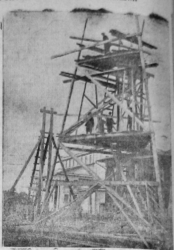
На фото: постройка парашютной вышки.

Парашютная вышка на дворе клуба КОР будет готова к 12 сентября. Вышку строят транспортный и городской комсомолец Осавьяхина. Высота вышки 25 метров. 12 сентября с вышки будут прыгать на парашюте комсомольцы, сдающие зачеты по военно-техническим экзаменам. Парашют уже получен из Москвы.