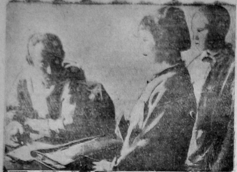
Привет новым ученикам в Вологодской ягтовой техникуме.