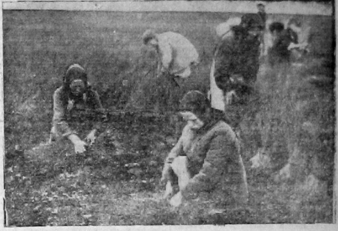
Теребление льна в колхозе «Красная горка», Турундаевского сельсовета.

Погода начала меняться. Части дожди. Но до сих пор в колхозе „Путь Ленина“ скошенный хлеб лежит в валках. В ряде колхозов рожь не заскирдована. Всем колхозам надо брать пример с колхоза им. Парижской коммуны, где колхозники полностью заскирдовали рожь. Ни в одном колхозе Спаского сельсовета не подготовлено гумеников. Далеко не везде подготовлены овинны. Агрономы МТС на местах обязаны помочь колхозам устранить все эти недостатки ведущие к потерям урожая, затяжке уборочной и к затяжке выполнения обязательств перед государством.