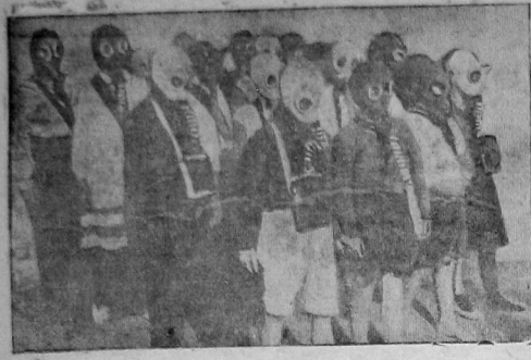
В опереттаре «Водосвета» пионеры изучают противопогаз Фотос пионеров Цейтлина