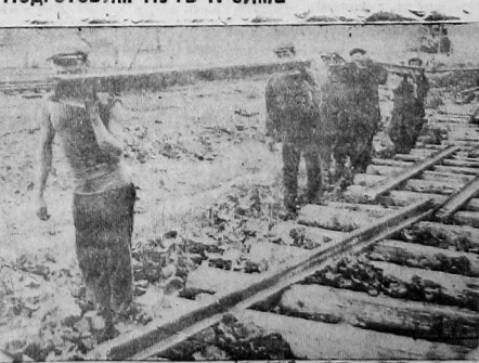
На ф. 4. Ударная бригада укладчиков на строительстве путей московского парка

Двадцать семь тысяч кубометров балласта привезено из карьера на станционные пути. Свежая насыпь—новый путь проложен к колхозникам. Строить соблюдают план, мастер Вертугин руководит работой бригады укладчиков рельс и установкой стрелок. Имен восемь укладчиков вместо 20, бригадир т. Басистый ежедневно перевыполнял плановые задания. По све-