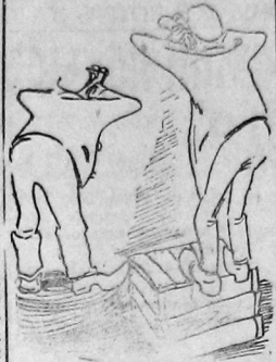
Сабуров. — Кажется, клиент с грузом повиснул... Нач. пристани: Да это же старуха падетесь...

Клиенту срывает нормальную работу пристани. Мало того, что она несет за непредъявление грузов денежную ответственность. Нужно привлечь к ответственности самих руководителей организаций.