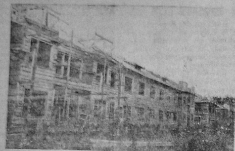
На берегу реки Топши в Чехове... строится красивой дом отдыха площадью 2500 кв. метр. Для постройки зарегистрировано 418000 р. израсходовано 380.000 руб. Постройка должна быть готова к 15 августа...

ВОСЕМЬ АВИМОДЕЛЕЙ сделали опытеры лагеря паровоз-ремонтного завода. ПРОВЕЛИ СУББОТНИК в школе «Молодежь комсомола» швей-прома. КООПЕРАТИВНАЯ СЕКЦИЯ горсовета заканчивает работу по обследованию зернохранилищ.