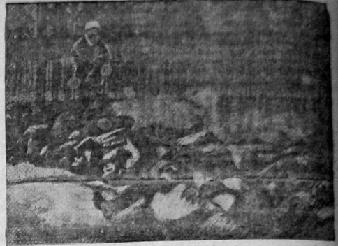
«За веру, царя и капиталистическое отечество» ВСТРЕЧА МЕЖДУНАРОДНОГО КРАСНОГО ДНЯ