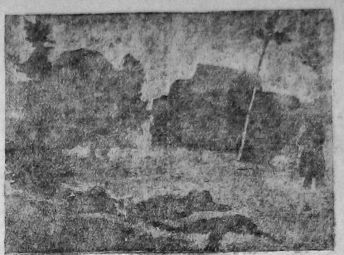
«После боя». С картины художника Тимофеева (выставка картин Вологодских художников в музее)

Стави вопрос о качестве нельзя умолчать и о кино «Искра». По невинным нам причинам на третьем подвемея звуковая иллюстрация «тринадцатого» подделаны. Не менее страны и неспойнты лишнейшие антракты-перекруты между отдельны