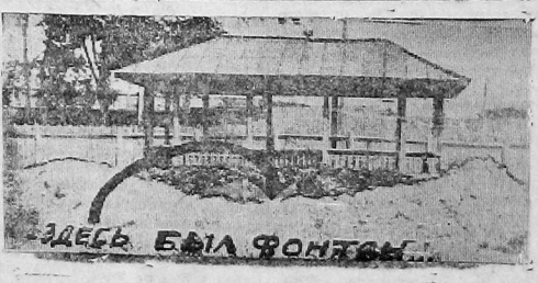
ЗДЕСЬ БЫЛ ФОНТАН