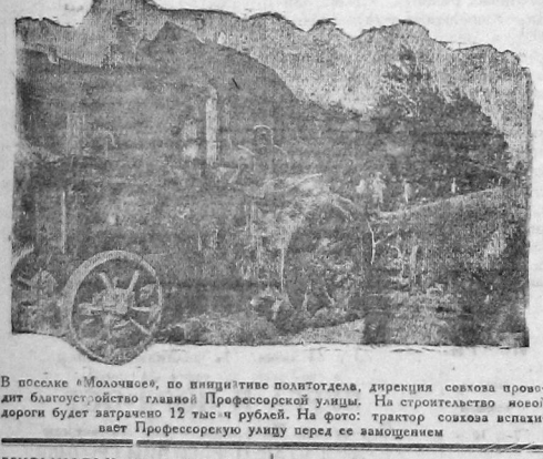
В посеве «Молодич», по инициативе полководца, дирекция совхоза проводит работу по развитию гашини Профессорской усадьбы. На строительство новой дороги будет затрачено 12 тыс. рублей. На фото: трактор совхоза вспахивает Профессорскую усадьбу перед ее завождением