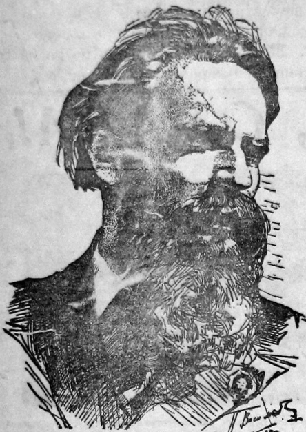
Рис. худ. П. ВАСИЛЬЕВА