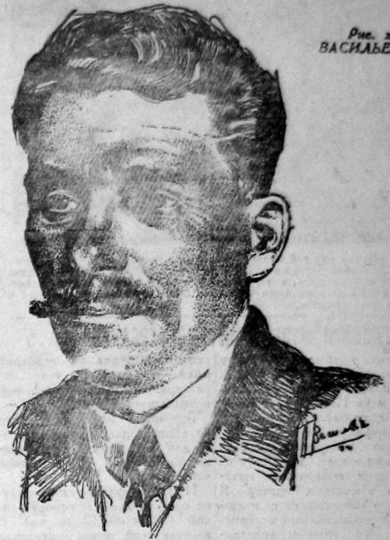
Рис. худ. ВАСИЛЬЕВА

Десять колоннами вынают на площадь трудящиеся всех районов Москвы. Лозунги, макеты, плакаты, цветы движутся над головами. Приветственные возгласы, громкое "ура" не умолкает. В воздух влетают детские разноцветные шарик и большие шары с приветственными надписями.