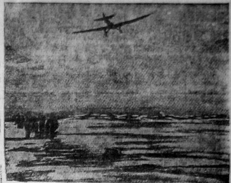
Самолет над лагерем Шиндита

Горком ВЛКСМ — Выльоз. Комиссия по проверке оздоровительных мероприятий среди детей при горкоме ВКП(б). Лесотельский.