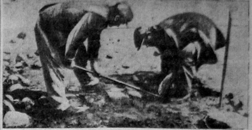
Ремонт мостовой на площади Свободы.

Вчера в объявлении о концерт-лекции «Университет культуры» ошибочно вместо композитора ГЮССЕКА упомянут Девясов (как известно автор «Интернационала», впервые исполняющего только в эпоху Парижской коммуны).