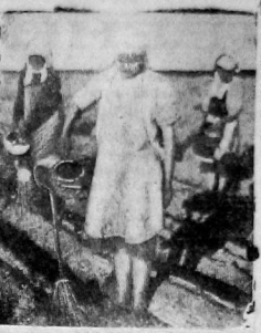
Овощам хороший уход