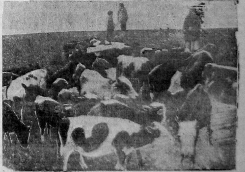
Стадо на пастбище.