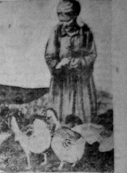
Колхозники заводят в своих хозяйствах не только кур, но и гусей, уток, поросат, кроликов. На фото: Колхозница «Правда» со своими гусиными гусями.