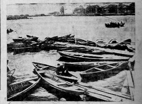
Водная станция Освода около пристани.

Плохо распространяется печать в Ивановском сельсовете. На сегодня выполнена только половина контр-позного задания. До окончания летней кампании остается две-три дня, Ивановским необходимо добиться полного выполнения контрольной цифр по печати.