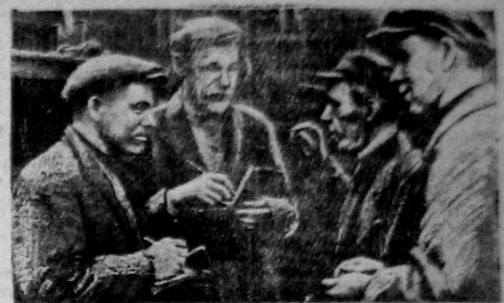
Техническая комиссия на пароходе «Изобретатель» осматривает машину перед выходом в рейс