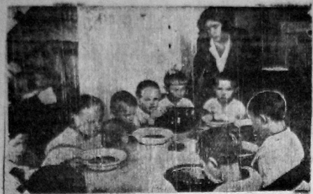
Завтрак детей в детском саду железнодорожников