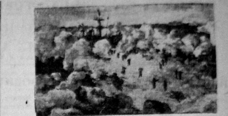
«Шляпки» перебираются на ады. Эскиз художника Тимофеева выставленный на вологодской осенней выставке.

До сих пор не убрана грязь с правой стороны сада (по ул. Возрождения). Осодина и органы милиции за порядком в садике не следят.