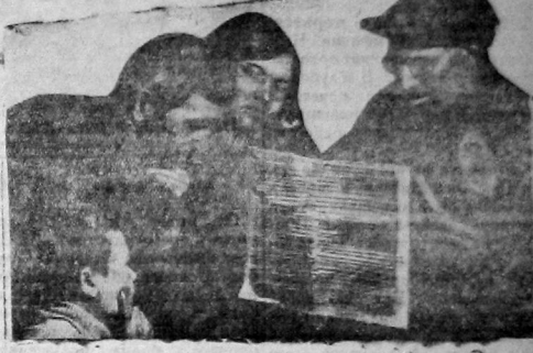
Со страниц номера «Красного Севера».

Такое же обещание дали редакторы и других стенгазет.