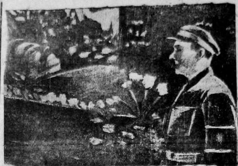
На сценке: В. Р. Менжинский в гробу в Колонном зале Дома союзов. Справа—тов. Ягода в почетном карауле

На площади части войск ОГПУ встречают прах своего начальника. Среди рядов этих войск, окаймленная зеленой полосой пограничников, процессия движется на Красную площадь, залитую народом. Члены политбюро поднимаются на трибуну мавзолея. Тов. Жданов объявляет открытым траурный митинг.