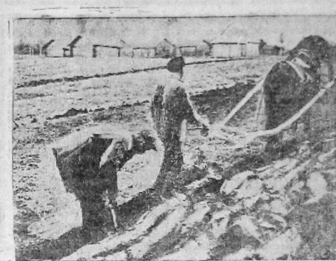
Председатель колхоза «Ударник» пропашет глубину вспашки.

Горком и политотдел в колхозы, совхозы и пригородные хозяйства командировал лучшие силы партияка в главе со всеми членами бюро горкома. С этой крепкой помощью наши сельсоветы и колхозы, совхозы и пригородные хозяйства могут и должны побольшевить, удвоить темпы, при строгом соблюдении качества всех работ — вывести Вологодский район по всем секторам на первое место в крае — по севу, по вспашке целины, по овладению агротехникой!