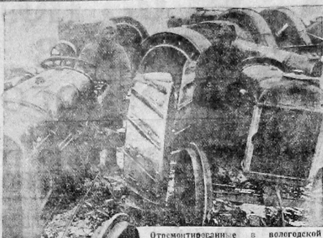
Отремонтированные в колхозской мастерской тракторы направляются в совхоз «Северная ферма».

Завтра по всему Северному краю дождется пробный выезд в поля колхозов. Этот выезд пройдет в под знаком массовой проверки фактической готовности каждой колхозной бригады к 3-й большевистской весне. Все же колхозы готовы к выезду в поле? Вот передовые бригады, которые готовы пахать сева: